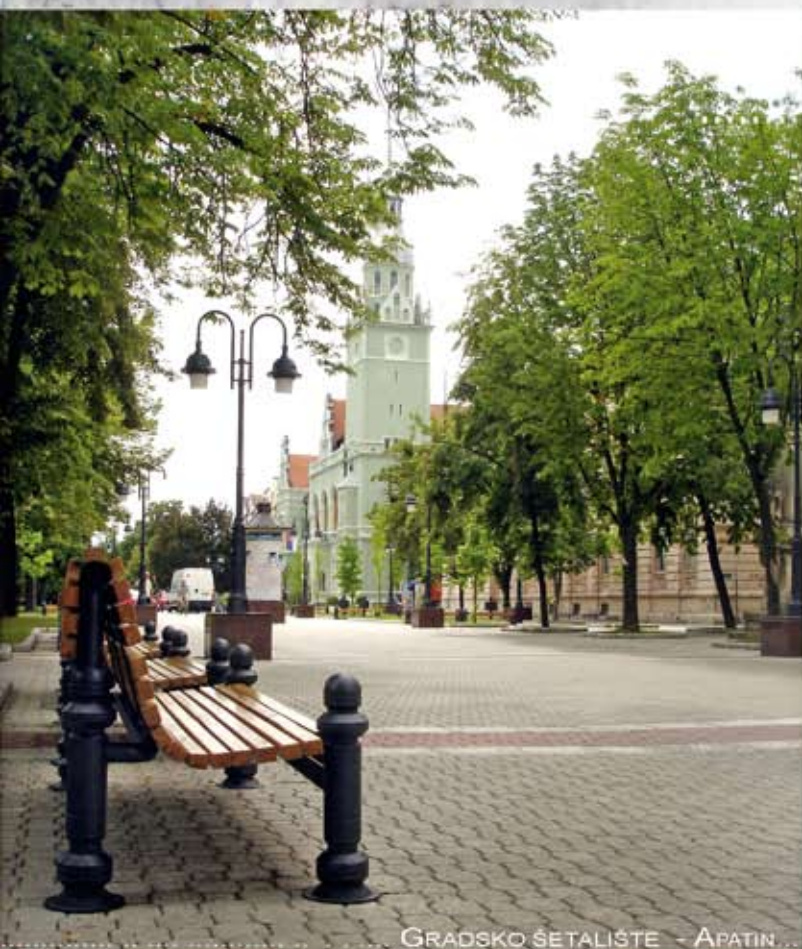
GRADSKO ŠETALIŠTE - APATIN ...