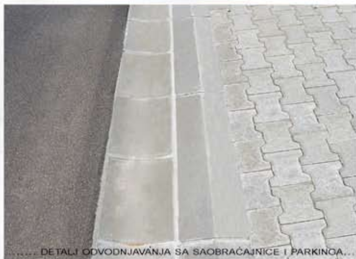
..... DETALJ ODVODNJAVANJA SA SAOBRAĆAJNICE I PARKINGA.....